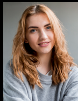
Professionelt og velligende billede

susannecarlsen@email.com Telefonnr. Hjemmeside Linkedin.com/susannecarlsen